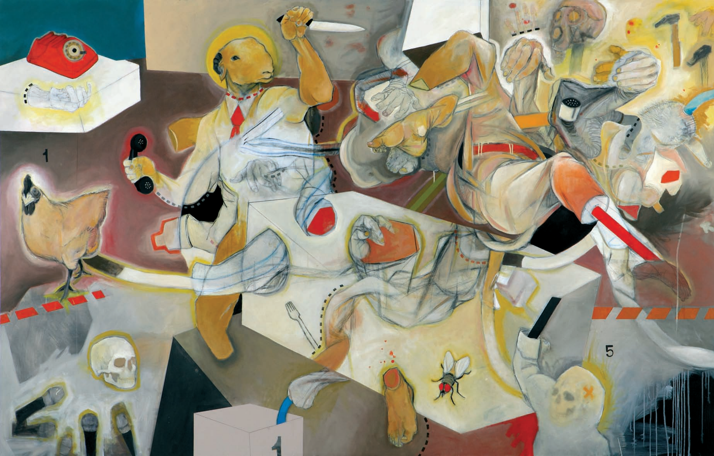
Exercise 1 - 2012 - 200 x 200 cm - Oil on canvas