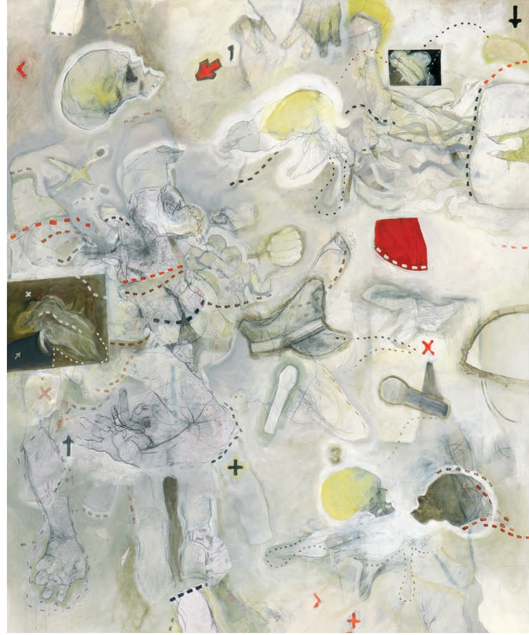
Exercise 1 - 2012 - 200 x 200 cm - Oil on canvas