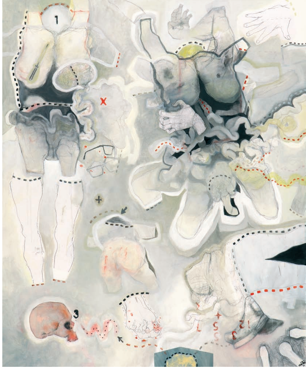
Exercise 1 - 2012 - 200 x 200 cm - Oil on canvas